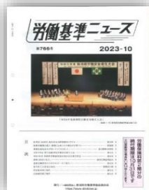
労働基準ニュース・中災防ポスター