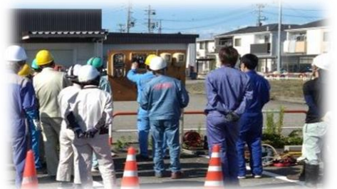
低圧電気特別教育